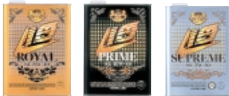
自動車用潤滑油SLシリーズ 「コスモリオROYAL」「コスモリオPRIME」「コスモリオSUPREME」

収益拡大のもう一つの切り札と言えるのが7月に行った、当社のSSオイル「コスモLIO」シリー